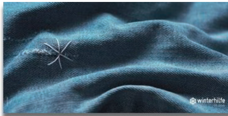
Plakatsujet 2016 von Döne Akpınar, Schule für Gestaltung Basel

Vielen Dank auch an die Kirchgemeinden, die uns bei der Vergabe der Kollekten berücksichtigen.